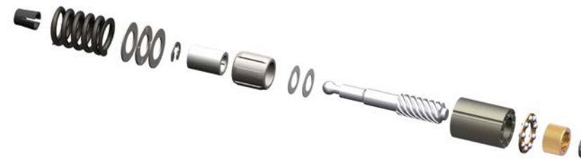
Innere Mechanik: BPW Zuspann- und Nachstelleinheit

* theoretische Beispielrechnung, auf der Basis von 10.000 Bremssätteln und 36,7 kg CO 2 äq.