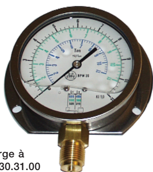
Manomètre de charge à l'essieu BPW 02.0130.31.00

Grâce au manomètre BPW, le client dispose d'un affichage facile et suffisamment précis du statut de chargement. De plus, cet affichage simple lui permet de gagner beaucoup de temps au chargement et au déchargement. Toute pesée supplémentaire des véhicules devient alors inutile.